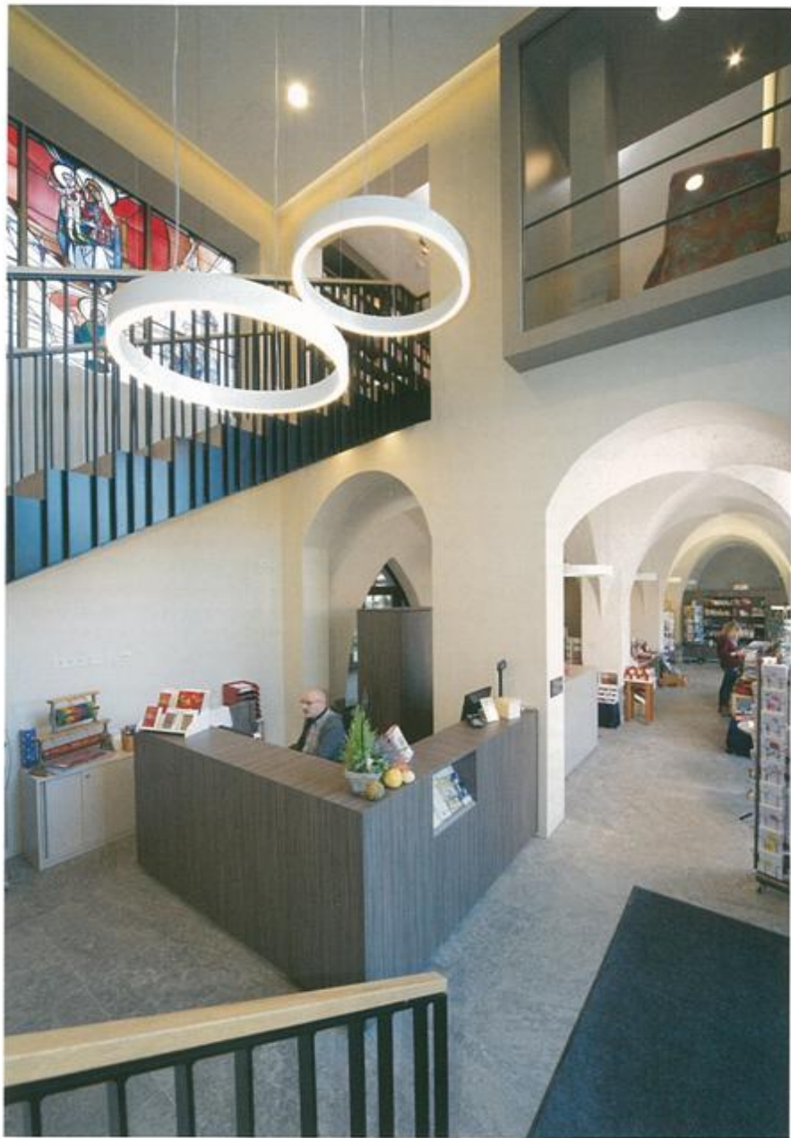
148 Das „Foyer Vinzenz Pallotti“ hat drei Funktionen: Eingang zum Missionshaus, ...