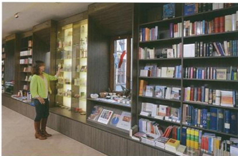
150 ... und „Klosterbuchhandlung“ mit einem reichen Angebot.