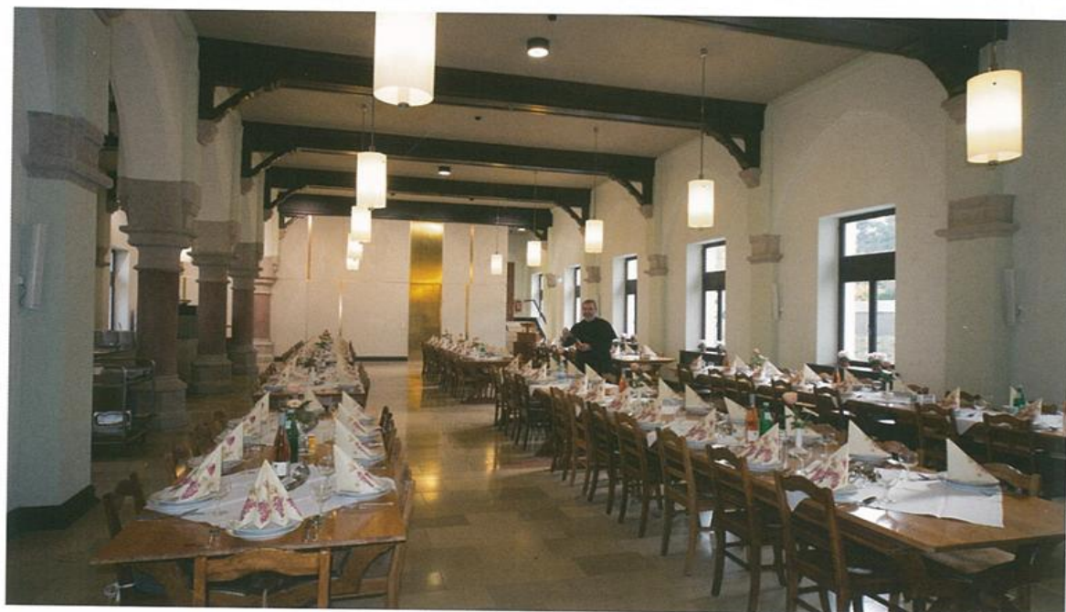
147 ... und verbindet in seiner historischen Farbgebung solide Einfachheit mit schlichter Eleganz.