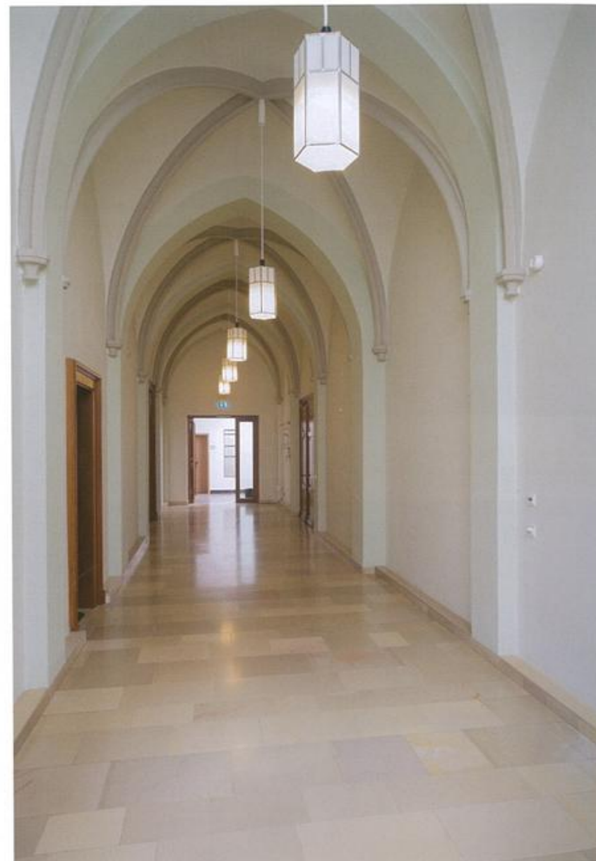
142 Die neuen Lampen und der jetzt dezente Anstrich der Bögen geben dem Flur zum Speisesaal, zum Bischof-Vieter-Saal und zum Seminarbau eine einladende Stimmung.