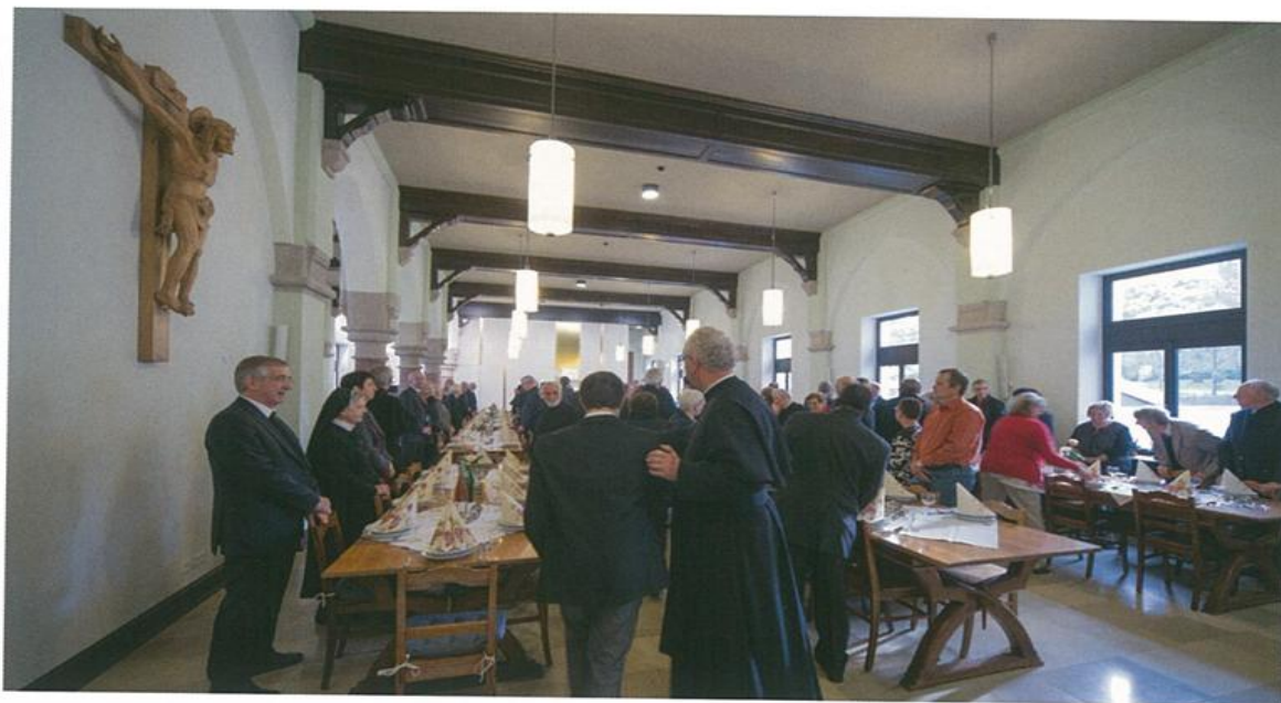
146 Der Speisesaal bietet Platz für hundert Personen ...