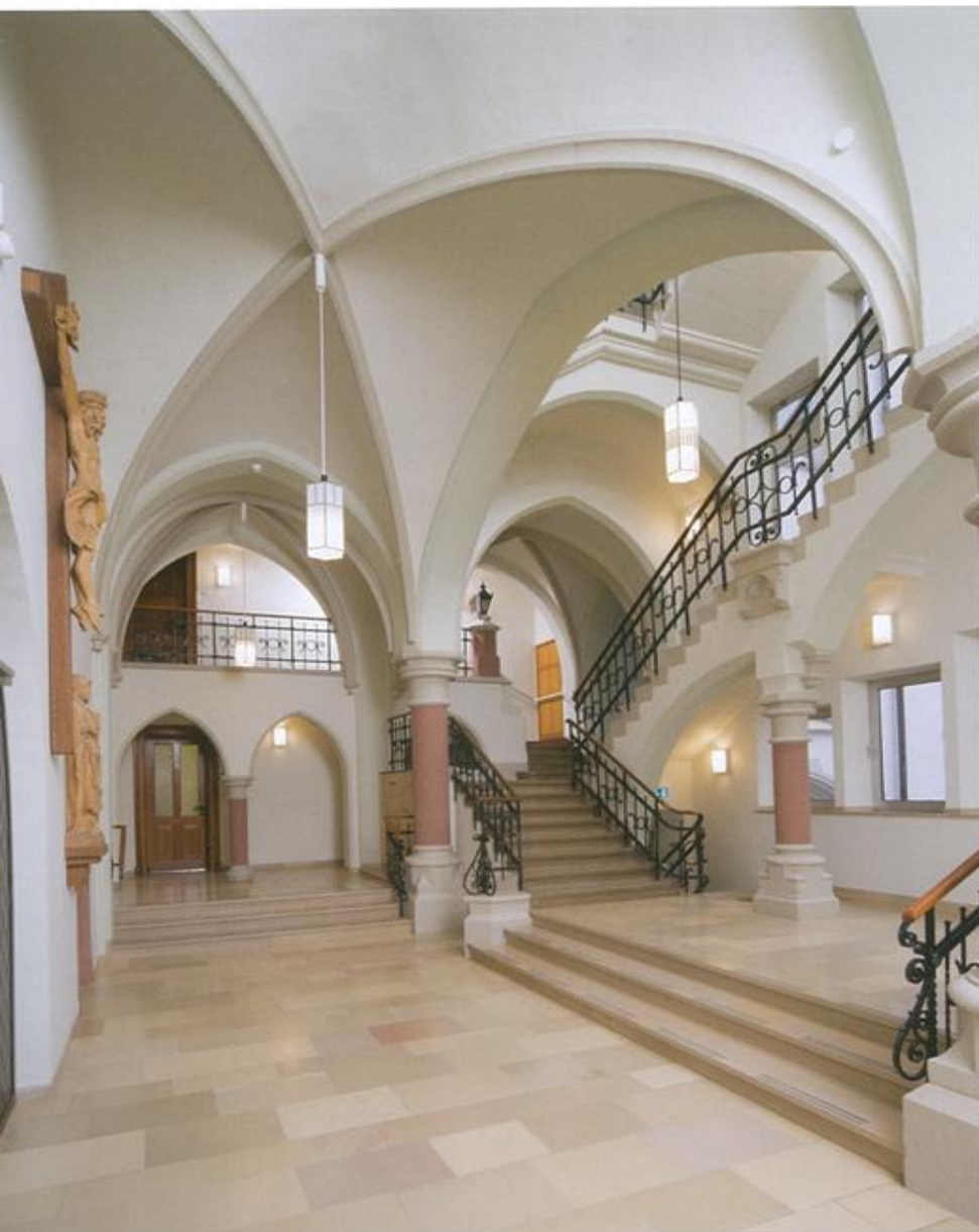
141 Großzügig und hell die alte und neue Eingangshalle des Missionshauses.