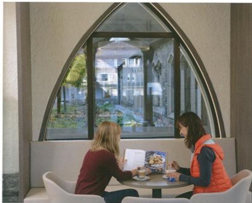
149 ... Ort zum Blättern, zum Ausruhen oder Austausch ...