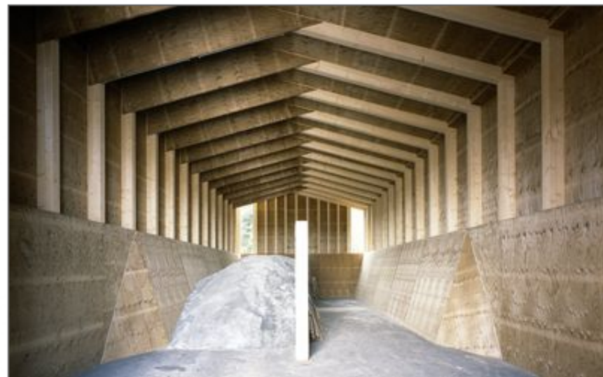
Holz erweist sich als sehr beständig gegenüber aggressiven Salzen.